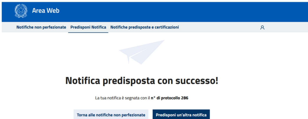
Fig. 7: esito creazione notifica

Una volta confermato verrà visualizzato l'esito dell'operazione con anche l'indicazione del numero di protocollo associato alla notifica creata. Si precisa che il numero di protocollo è un identificativo univoco all'interno del Portale.