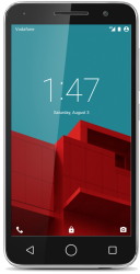
Vodafone Smart Prime 4G