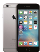
iPhone 6S 16GB Silver